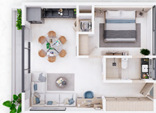
MODELO G/H 🏠 66.04m 2