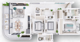
MODELO E 🏠 134.23m 2