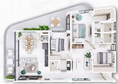
MODELO A 🏠 145.58m 2