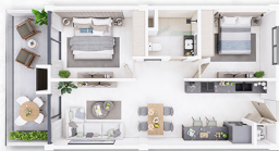
MODELO C 🏠 91.25m 2